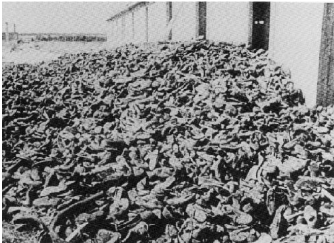
Archives of the Holocaust, Edited by S. Milton and R. Klemig, Garland publishing inc., NY and London, 1990, Vol. 1 part 2, picture number 863.