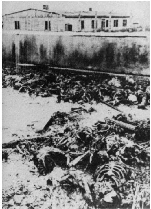
Der KZ-Staat, H. Kuhnrich, Dietz, Berlin, 1983, pp.144-145.

Scène horrible : les SS ont brûlé les corps des victimes, peut-être dans une tentative désespérée de cacher les traces de leurs crimes.